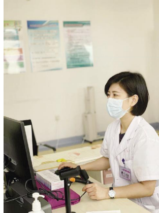
■ 本报记者 曹迎新

她是一名普普通通的基层预防保健工作者,在自己的岗位上默默守护,兢兢业业,任劳任怨,用无声的言语践行着“白衣天使”的铮铮誓言,她就是葫