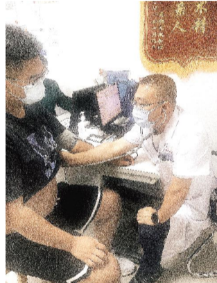
■ 本报记者 曹迎新

董金荣同志是千千万万医护人员中平凡的一位,她用一颗真诚的“医者仁心”温暖了无数人的心,用爱的星星之火点燃了千万人心中的明灯。